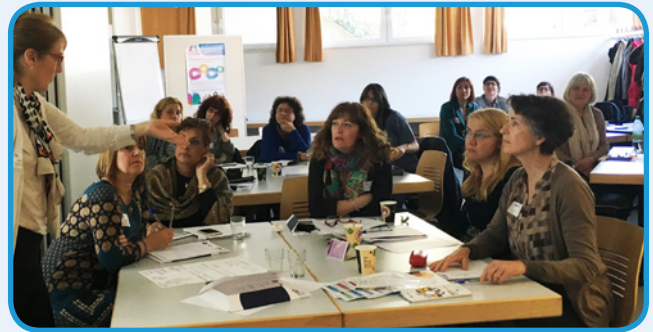
I partecipanti discutono durante una tavola rotonda tematica

Durante il seminario si sono tenute presentazioni specifiche su: